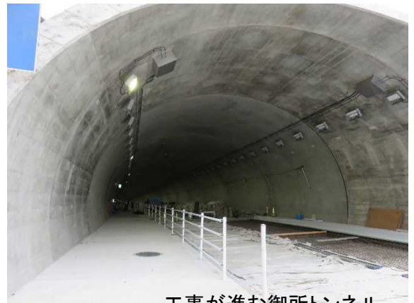
工事が進む御所トンネル

※取材を希望される方は、工事現場内のため、事前にお問い合わせ先(金沢河川国道事務所)までお申し込みください。