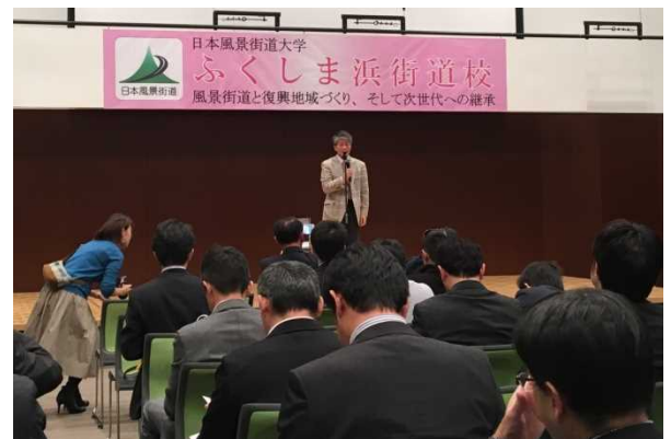
ふくしま 昨年度の開催状況(福島県いわき市)