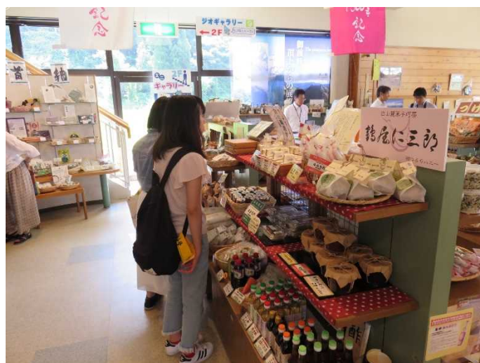
道の駅「瀬女」にて 商品調査を実施する学生