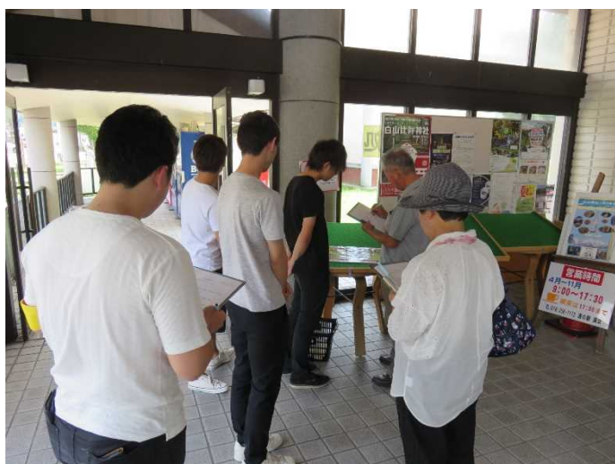
道の駅「瀬女」にて アンケート調査を実施する学生

(参考:現地調査実施案内の記者発表資料 http://www.hrr.mlit.go.jp/kanazawa/mb5_kouhou/press/h29/p0821_2.pdf )