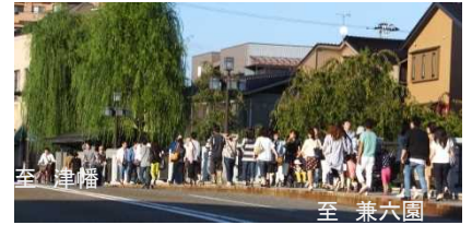
参考：平成27年9月の浅野川大橋の歩道利用状況