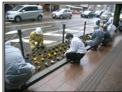
平成27年 春の花植の様子