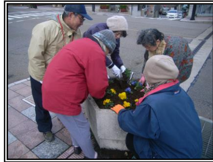
歩道プランターの花を季節の花に植え替えます