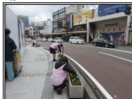
平成27年 春の花植の様子