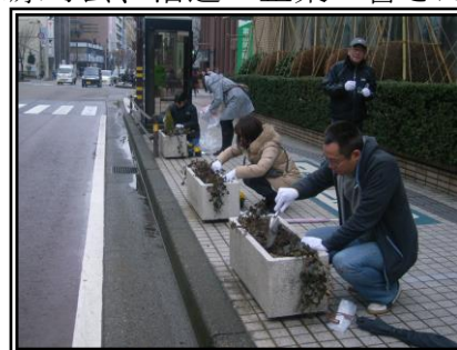
平成27年 春の花植の様子

(4)作業内容 植栽帯・プランターに春花 (パンジー) 約1100本を植栽する予定