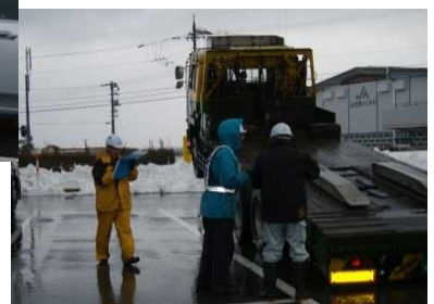
昨年度実施状況 (注意喚起・タイヤチェック状況)