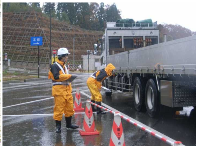
昨年度実施状況 (注意喚起・タイヤチェック状況)