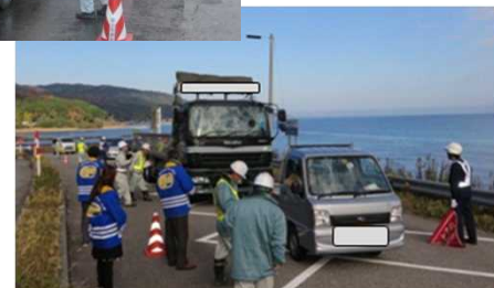
昨年度実施状況 (注意喚起・タイヤチェック状況)