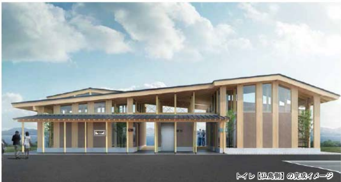
トイレ【仏島側】の完成イメージ