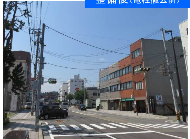
整備後(電柱撤去前)