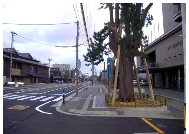
※写真データは提供可能です。