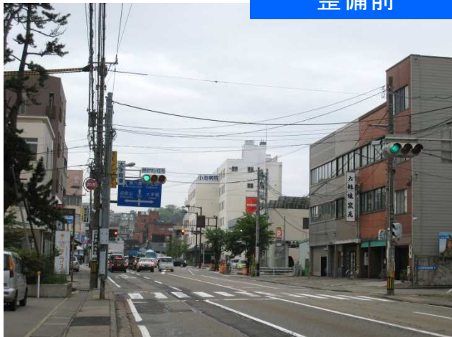
兼六園方向を望む