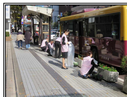
平成26年度 の秋の花植の様子