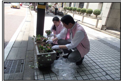
歩道植栽帯の花を季節の花に植え替えます