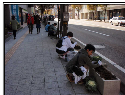
平成26年度 秋の花植の様子 (国道157号金沢市 みなみちょう 南町にて)