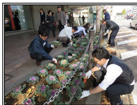
平成26年度 秋の花植の様子

(4)作業内容 植栽帯・プランターに冬花 (葉ボタン) 約920本を植栽する予定