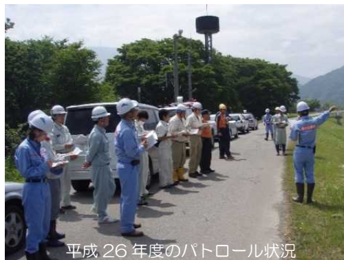
平成 26 年度のパトロール状況