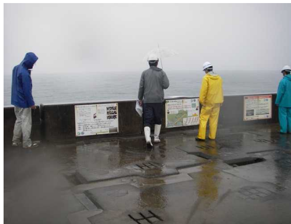
前年度の安全利用点検の様子（海岸）