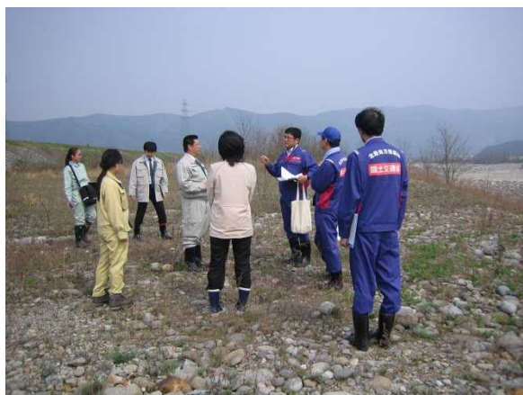
前年度の安全利用点検の様子（手取川）