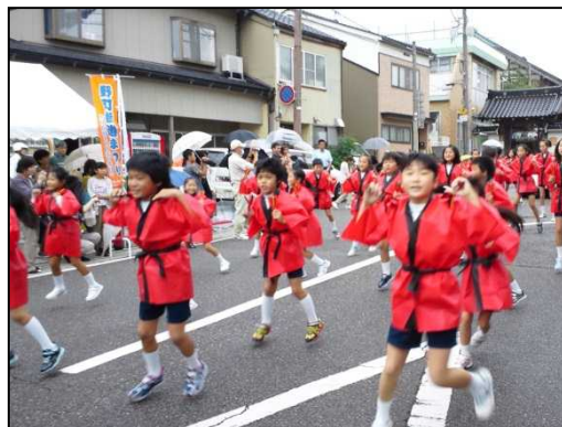
街道まつりの様子