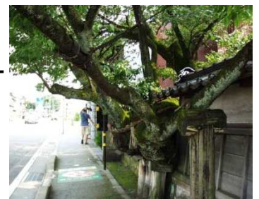
松月寺の大榎 (国指定天然記念物)