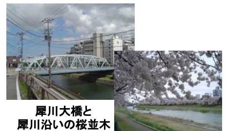
犀川大橋と 犀川沿いの桜並木