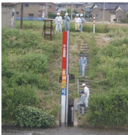
水位観測所の点検状況