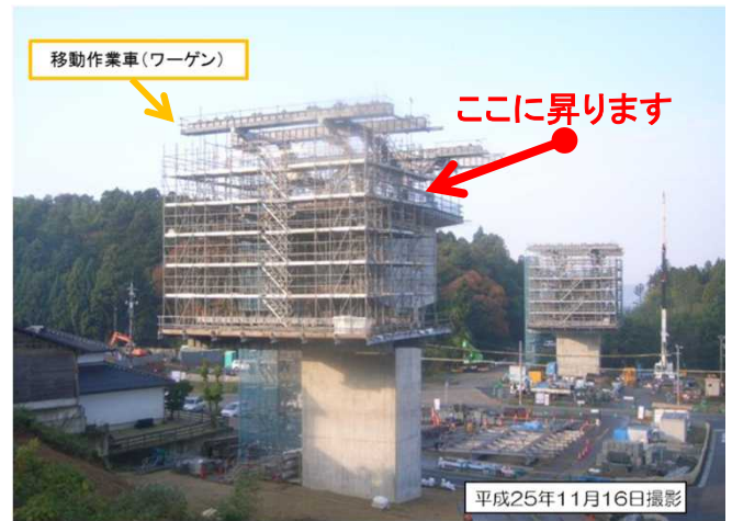
城山高架橋上部その1工事の状況

・PC片持箱桁製作工の現場見学 (15分程度) ～高さ25mの橋脚上にて工事現場を見学～