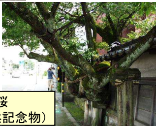
松月寺の大桜 (国指定天然記念物)