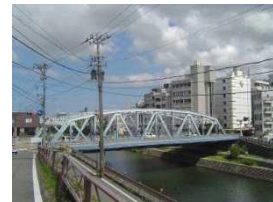
犀川大橋と 犀川沿いの桜並木