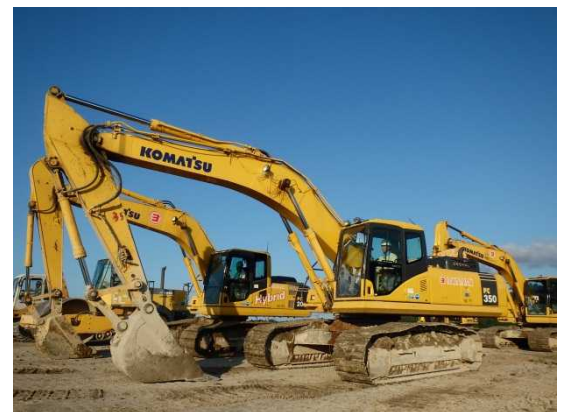
ふれあい体験で見学する建設機械