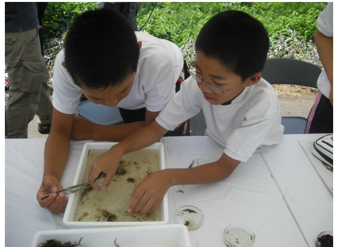
水生生物を分類しているところ（梯川）