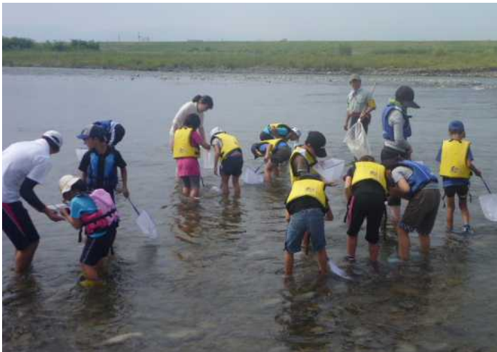
水生生物を採取しているところ（手取川）