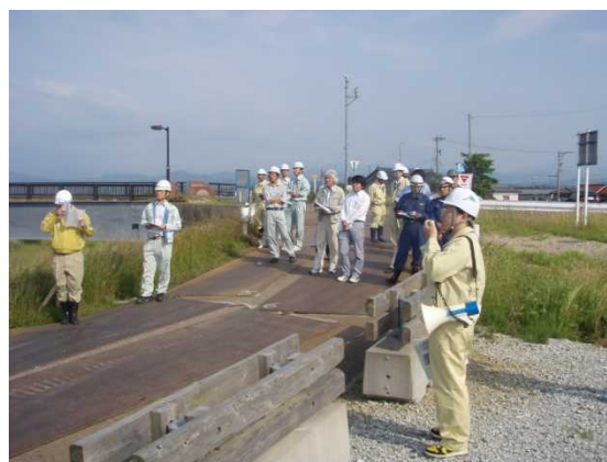
平成24年度の開催状況