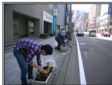
平成24年度の活動の様子 (国道157号金沢市上堤町にて)

(4)作業内容 プランターに春花 (パンジー、 ビオラ、ムルチコーレ、ノース ポール、ヘデラヘリックス) 約1,100株を植栽する予定