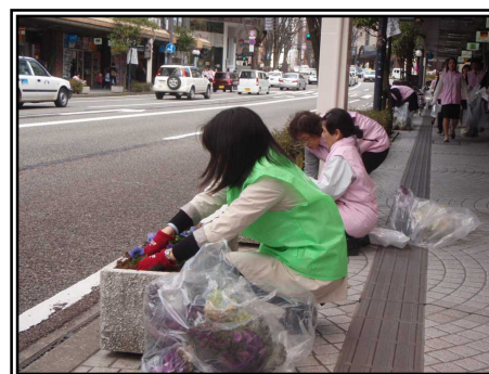
平成24年度の活動の様子 (国道157号金沢市片町にて)

(4)作業内容 プランターに春花 (パンジー、 ビオラ、ムルチコーレ、ノース ポール、ヘデラヘリックス) 約900株を植栽する予定