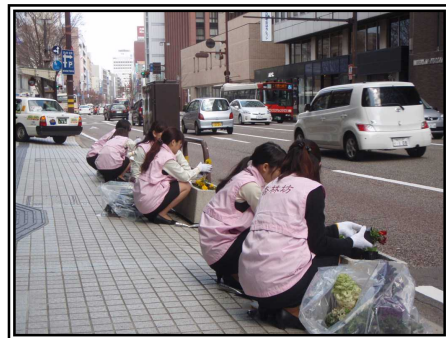
歩道植栽帯の花を季節の花に植え替えます 国道157号 金沢市香林坊 平成24年度実施