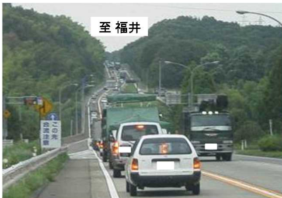
【国道8号東山の混雑状況】 (金沢方面から福井方面を望む)

平成15年3月の全線暫定2車線開通後、小松市内の混雑は緩和したものの、小松バイパスの交通量が増大し、朝夕を中心に走行速度の低下が著しくなっています。小松バイパスの混雑緩和に向け、平成19年度より4車線化を随時進めています。