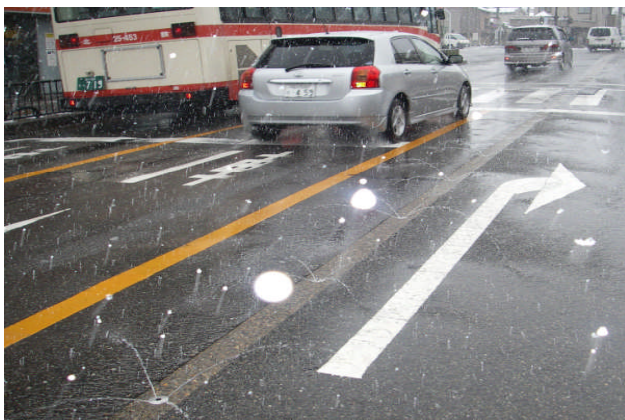
国道157号(金沢市街地部)消雪パイプ稼働状況