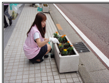
平成22年度の活動の様子 (国道157号金沢市片町にて)