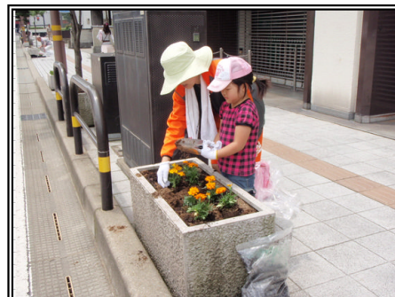
平成22年度の活動の様子 (国道157号金沢市香林坊にて)