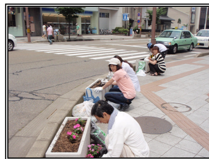
平成22年度の活動の様子 (国道157号金沢市尾山町にて)