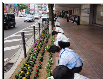
平成22年度の活動の様子 (国道157号金沢市武蔵町にて)