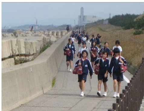
中学校の遠足ルートとなっている松任・美川工区