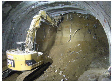
さらさらの緩い砂層に鋼管と薬液を注入し地盤を固めながら掘削 （東長江側坑口から1,000m地点）