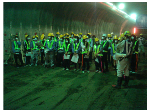
卯辰トンネル東長江側坑口付近 卯辰トンネル (山側) : 写真左側 工事中の卯辰トンネル (海側) : 写真右側