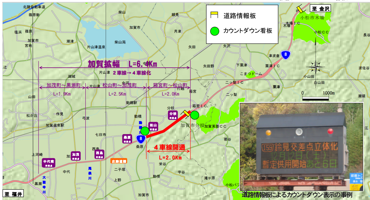
カウントダウンによる案内看板等位置図