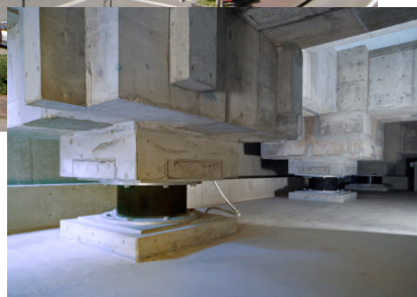
地下免震支承部状況