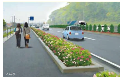
【国道8号緑化整備イメージ図】

金沢河川国道ホームページ http://www.hrr.mlit.go.jp/kanazawa/