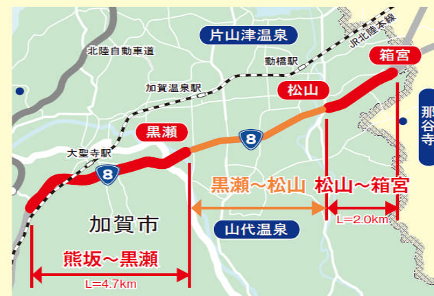
内の表記は交差点名です

この他、平成21年に4車線化を行った熊坂~黒瀬間についても、今年緑化整備を行う予定です。