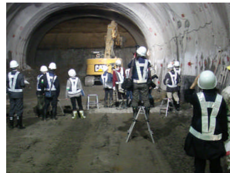
報道関係者を対象にした現場見学会 (平成22年4月20日)