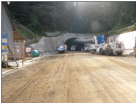
工中の卯辰トンネル起点部 ここから710m先まで掘削完了