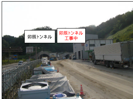
卯辰トンネル (山側): 写真左側 工中の卯辰トンネル(海側): 写真右側