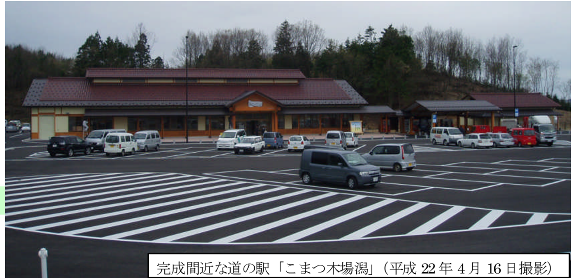
完成間近な道の駅「こまつ木場潟」(平成22年4月16日撮影)