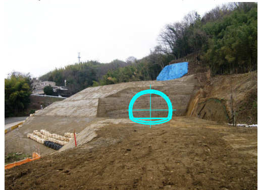
間もなく貫通を迎える鈴見側の坑口付近 （写真中央の青色部分がトンネルの断面）

現場での取材を希望される方は、事前に問い合わせ先までお申し込みください。ヘルメット・マスク・長靴は当方で用意します。