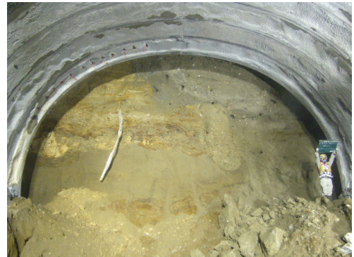
この先に鈴見側が見えるのはもう間近 （貫通まで残り17m地点の掘削面）

（※）本トンネル工事は、東長江側から鈴見側に向かって掘削を行っており、今回の貫通は、「掘削により鈴見側が見えるようになる」という段階です。したがって、道路として完成・供用開始までには、あと2年ほどかかります。