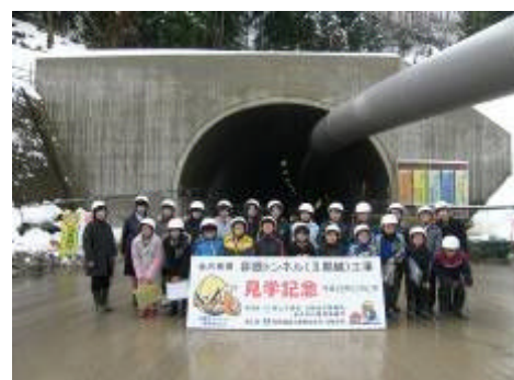
卯辰トンネル東長江側坑口付近 卯辰トンネル (山側) : 写真左側 工事中の卯辰トンネル (海側) : 写真右側