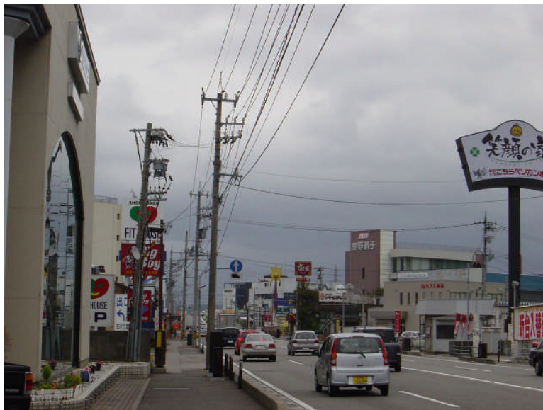
野々市町横宮町付近（福井側より金沢方向を望む）