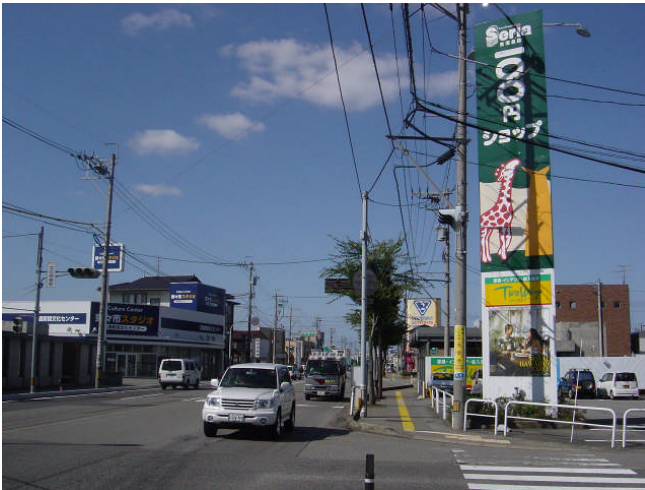
Before (撮影: H19年10月)