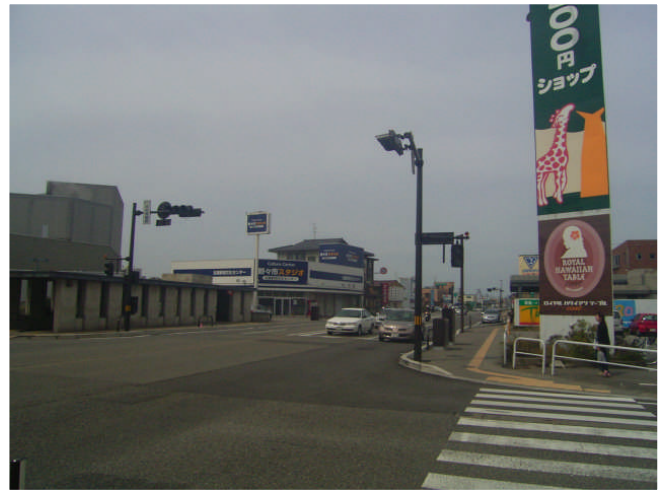
After (撮影: H21年4月)