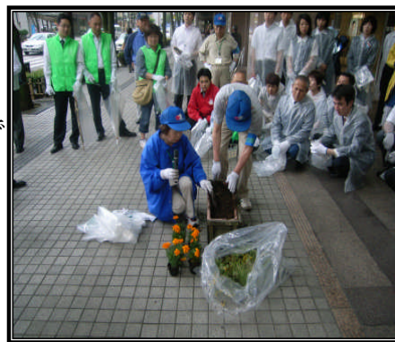
平成20年度の活動の様子 (国道157号金沢市片町にて)