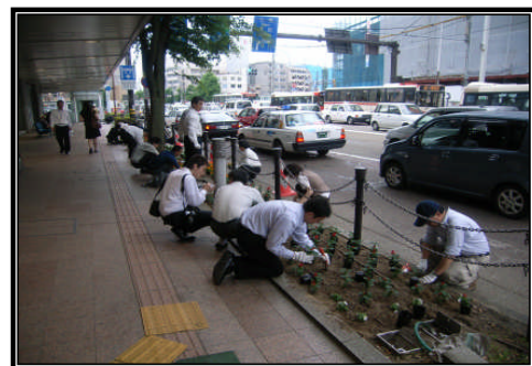
歩道植栽帯に季節の花を植えている 国道157号 金沢市武蔵町