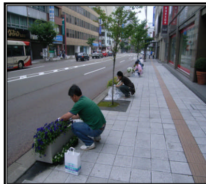
平成20年度の活動の様子 (国道157号金沢市下堤町にて)