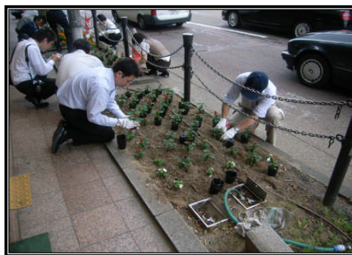
平成20年度の活動の様子 (国道157号金沢市武蔵町にて)