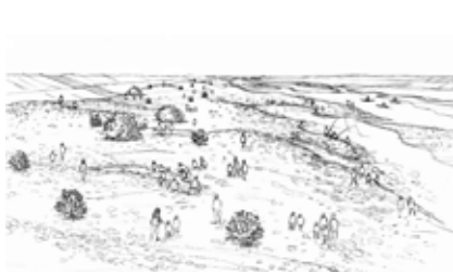
石の河原イメージ