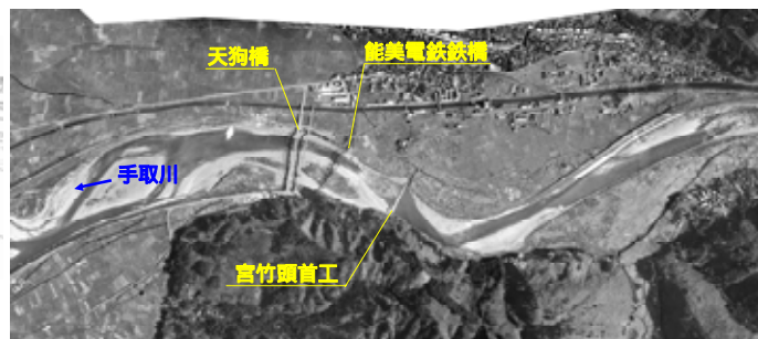
昭和30年頃【砂礫河床】