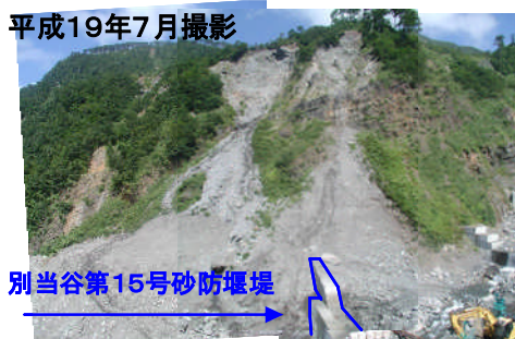
別当谷第15号砂防堰堤