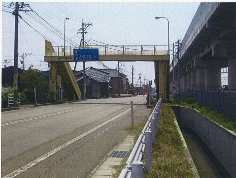
国道 159 号金沢市南森本町 (写真右は工事中の北陸新幹線高架橋)