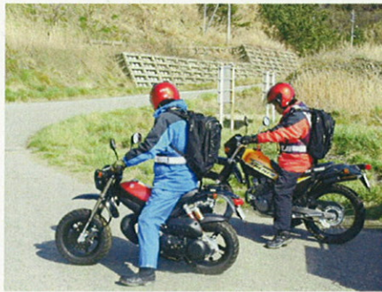
写真-1. 出動するバイク隊 (3/26)