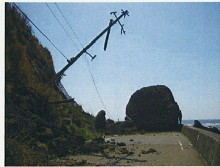
写真-2. 市道 道下深見線の状況