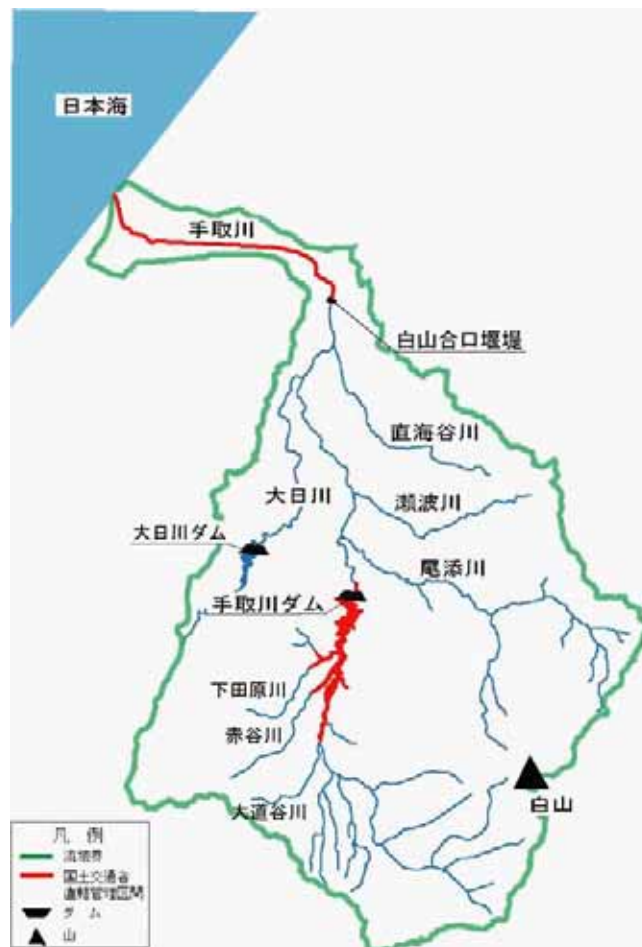
図57 手取川水系大臣管理区間