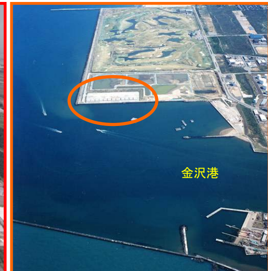
新型人工リーフ工事箇所