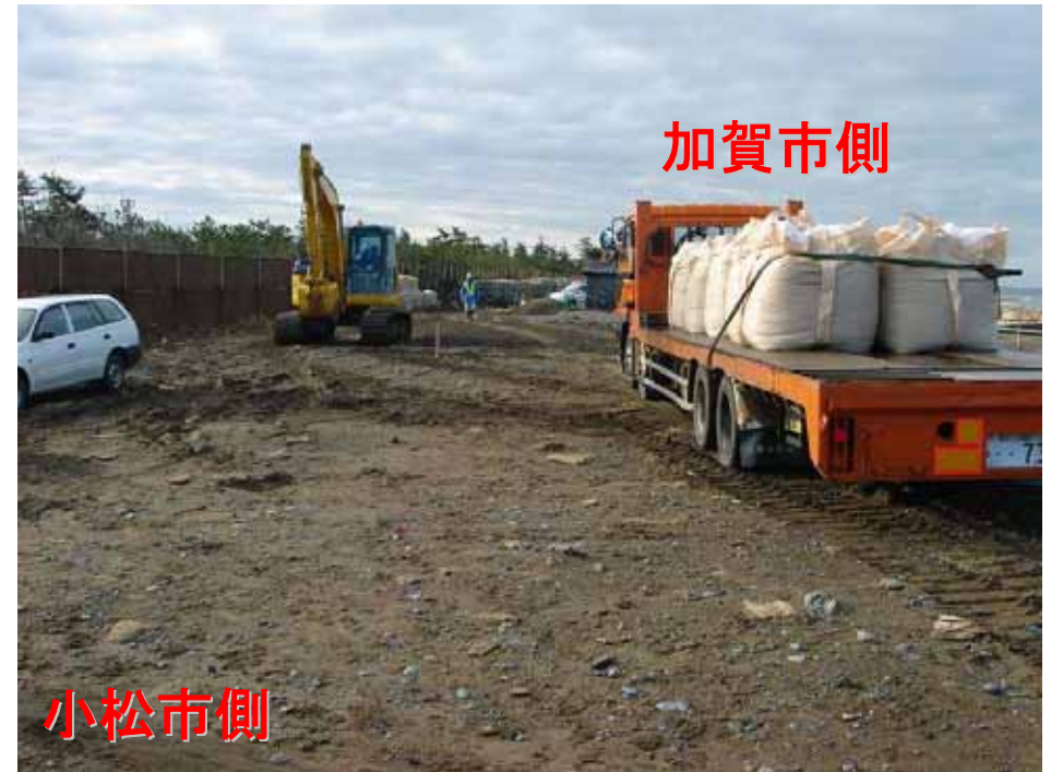
工事着手状況(H17.12.7AM撮影) 【小松市安宅新地先】