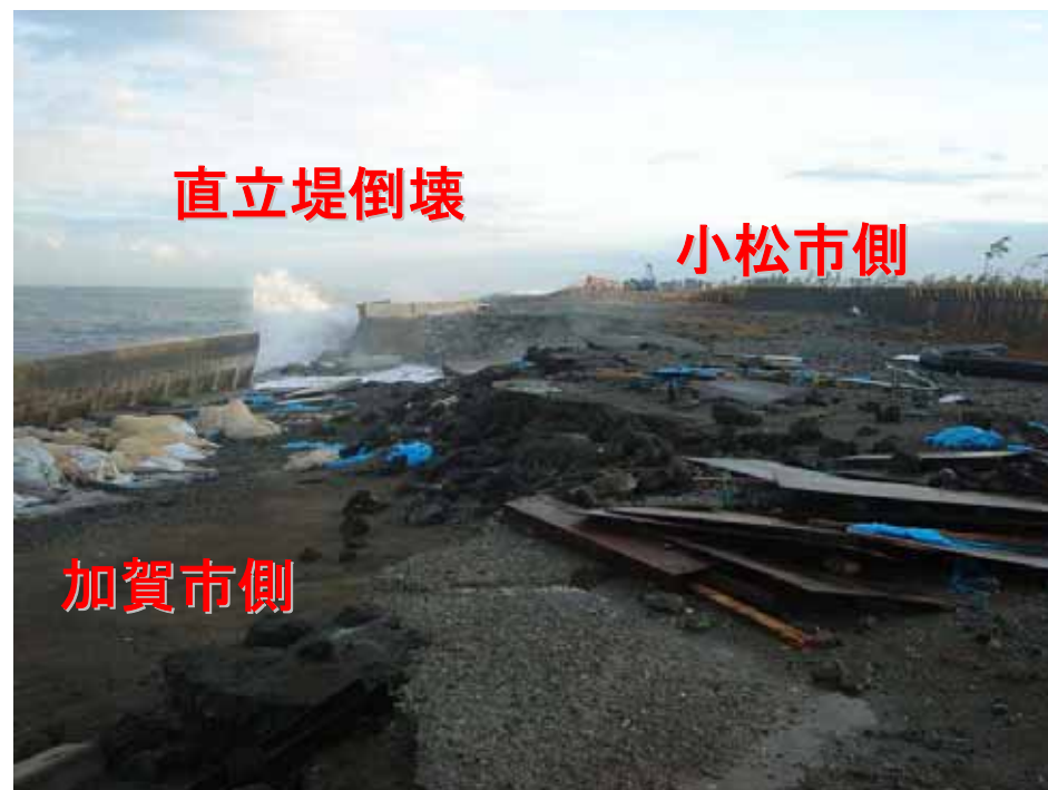
被災状況写真(H17.12.7AM撮影)