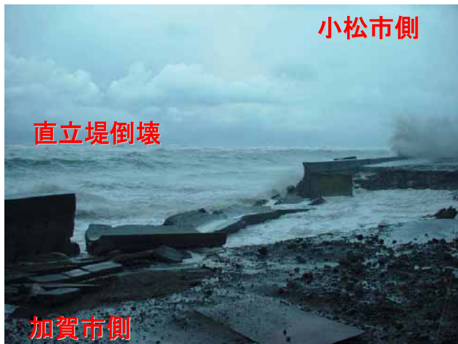
被災状況写真(H17.12.5未明撮影)