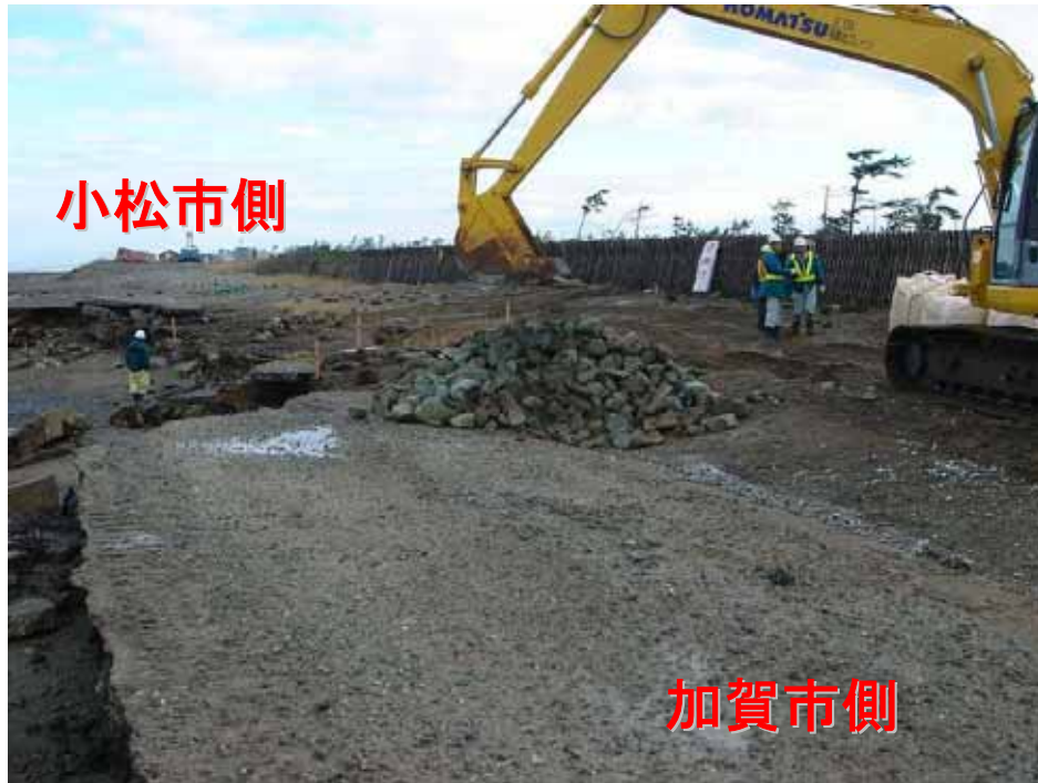
工事着手状況(H17.12.7AM撮影) 【小松市安宅新地先】