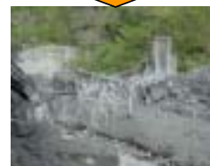
土石流により流失した吊橋