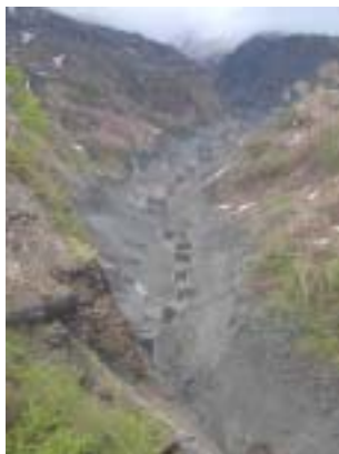
土石流の発生した別当谷全景