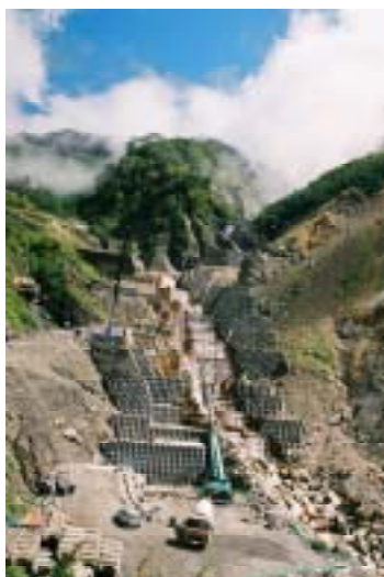
導流落差工の施工状況