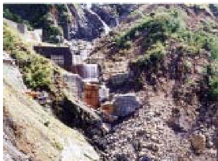
H4年の出水による柳谷第3号、第6号砂防えん堤の被災状況

当地域は特別豪雪地帯で施工可能期間が限られていることから、補正予算(ゼロ国)制度により発注手続き等を前倒しすることで、的確な着手前準備と迅速な施設整備を図ることができます。導流落差工の左岸側は落石・崩壊の危険が高いため、大型無人クレーンによる完全無人化施工により工事を推進します。また、柳谷第22号えん堤において嵩上げ工を推進します。