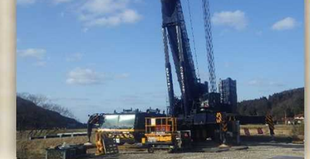
650ト吊 大型クレーン