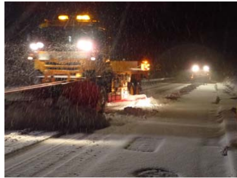
【今冬初めての除雪車出動 (国道470号 穴水町七海地先)】