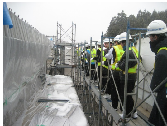
【工事現場を見学する輪島中学校の生徒】

関連URL：記者発表資料 http://www.hrr.mlit.go.jp/kanazawa/mb5_kouhou/press/h29/p0111_1.pdf