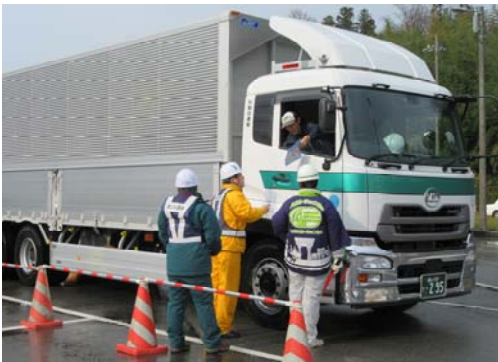
【雪みち安全走行の注意喚起 (国道8号津幡北バイパス(上り)チェーン着脱場)】

まだまだ降雪期は続きます。冬用タイヤの着用やチェーンの携行、早めのチェーン装着をお願い致します。お出かけの前には、道路情報・気象情報を確認し、慎重な運転を心掛けて下さい。