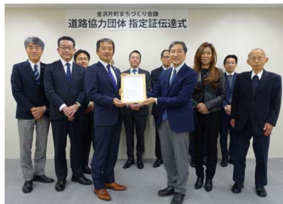
【「道路協力団体」指定証伝達式の様子】

「道路協力団体」として今後、国道157号（香林坊2丁目～犀川大橋間、約820メートル）を対象に、オープンカフェなどで得た収益を①道路清掃、②花植え（全区間）、③犀川大橋ライトアップ支援、④ベンチの設置・管理等、道路の維持管理に還元していく予定です。