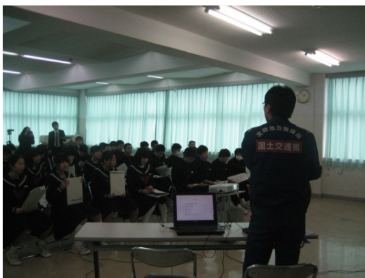
【能越自動車道 輪島道路の説明】

参加した生徒からは「道路工事の工程や職場の環境が理解できた。」、「建設産業の仕事は大切だとわかった。」、「びっくりするほど怖いところで大変だと思ったが、誇りを持てる仕事だと思った。」などの意見がありました。