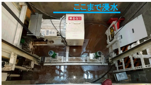
【近江町いちば側エレベーターの浸水状況】