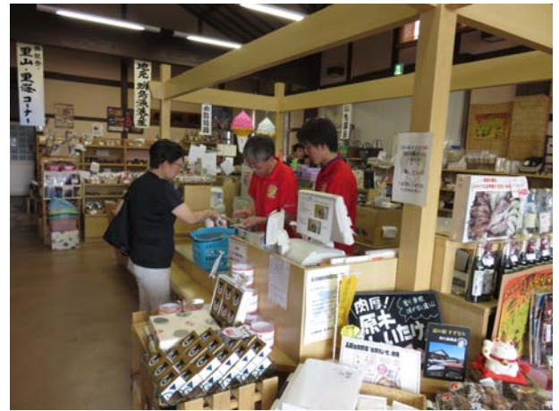
【物産販売所にてレジ対応を行う様子】

関連URL：記者発表資料 http://www.hrr.mlit.go.jp/kanazawa/mb5_kouhou/press/h28/p0812_2.pdf