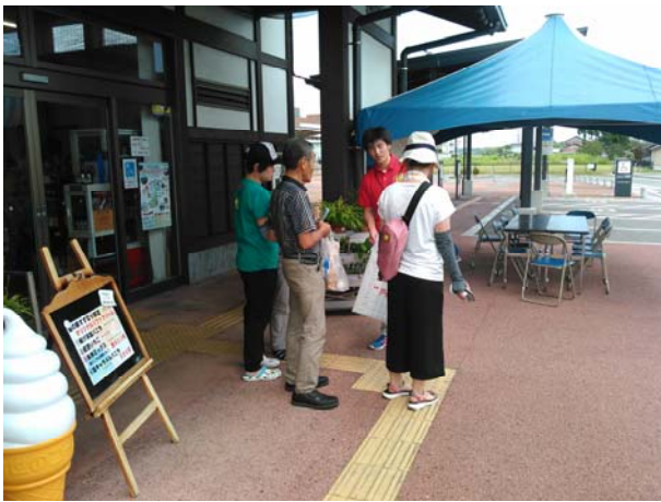
【道の駅利用者にアンケート調査を行う様子】

学生からは、「和気あいあいとした雰囲気を感じつつも、礼儀を忘れず相手を敬う気持ちを忘れない接客対応や行動に感動した。」「限られた期間の中、自分が何をし、どう計画を立てて行動しなければならないか教えてくれたインターンシップでした。」といった感想が聞かれました。