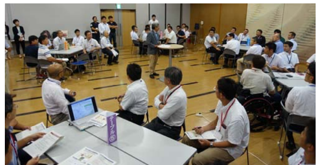
【ラウンドテーブル（円卓会議）の様子】

関連URL：記者発表資料 http://www.hrr.mlit.go.jp/kanazawa/mb5_kouhou/press/h28/p0831_1.pdf