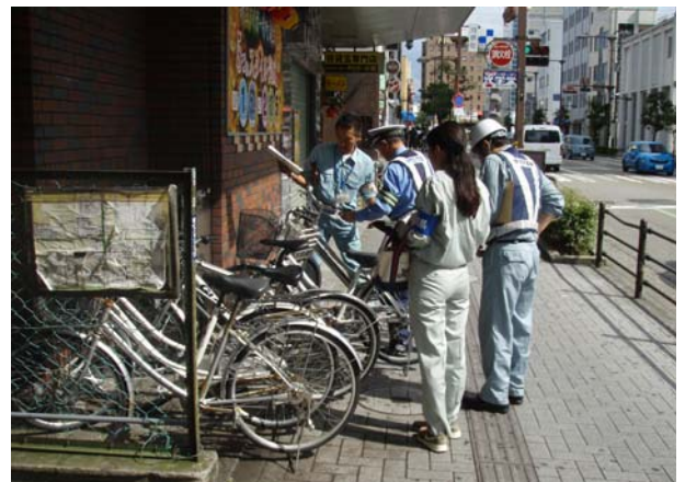
【合同パトロールの様子】

この日は、石川県、金沢市、石川県警察、金沢河川国道事務所の職員14名が参加し、市役所前で出発式を行った後、3班に分かれてJR金沢駅前から片町周辺の計3.4キロを巡回しました。その結果、63件の違反が見つかり、そのうち所有者が特定できた49件について撤去や改善を指導しました。