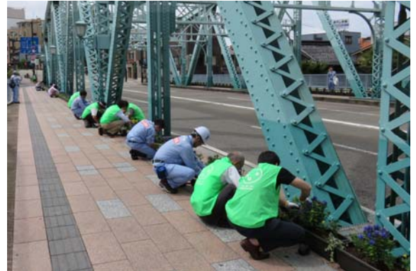
【花植えを行っている様子】

ライトアップは、路面から高さ5mの位置にある横梁にLEDを設置し、犀川の川面に浮かぶ幻想的な犀川大橋が演出されました。