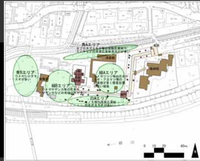
対象地内植物一覧表