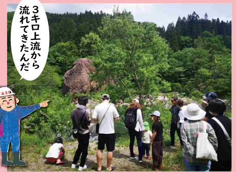
水量が多く百万貫の岩の近くまでは行けませんでしたが、遠くから見ても大きい百万貫の岩に感嘆する参加者。