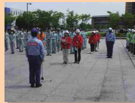
▶ 答礼（左）、白山市役所訪問（右）の様子