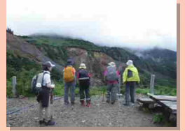
地すべり地形を観察！

砂防新道を自身の足で登りながら当時の砂防工事の苦勞に想いを馳せたり、白山の奥地に整備された大規模な地すべり対策施設に圧倒されたりと、新たな発見の多い2日間となりました。