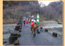
浦川スーパー暗渠砂防堰堤

浦川スーパー暗渠砂防堰堤の天端部分を歩いたり、平成8年12月に発生した浦原沢土石流災害について学んだりしました。