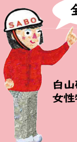
白山砂防女性特派員