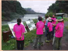
本宮砂防堰堤の迫力に圧倒されました！