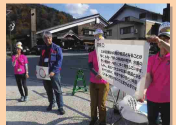
温泉まつりの様子