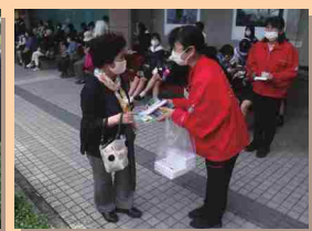
◀ 街頭広報（香林坊大和前）の様子