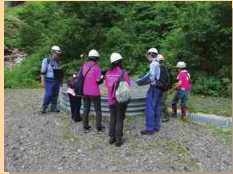
第2号集水井を見学！

甚之助谷地区第11号排水トンネルの施工状況や、別当谷上流崩落箇所での無人化施工状況などについて、各現場の監理技術者から直接お話を伺いました。