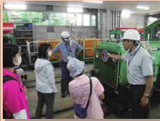
実際のトロッコを目の前で見ました！