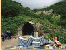
第11号排水トンネルを見学！