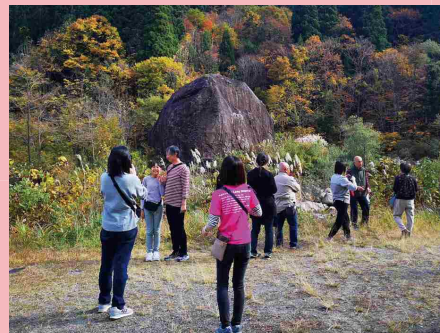
温泉まつりのジオツアーで紅葉の中、白山砂防女性特派員の解説を聞き、質問する参加者。