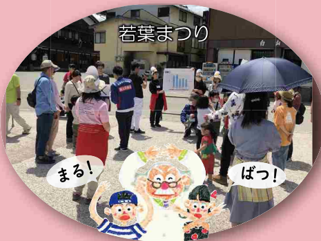
〇×クイズに挑戦する参加者

また、まつり会場には『出張！白山砂防科学館』のブースが開設され、土砂災害に関するパネルの展示や、リモコンパワーショベルでの無人化施工の体験コーナー、白山砂防女性特派員による『砂防クイズ』が開催され、勝ち残った参加者には砂防キャラクターサボちゃんの缶バッジ、マグネットなどのグッズがプレゼントされました。