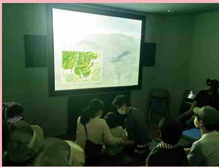
3Dシアターでは手取川大洪水が起きた当時の様子や迫力が再現され、土石流のすさまじさを体感しました。