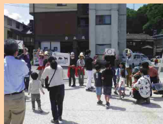
若葉まつりの様子

白山市白峰地区で毎年5月に開催される若葉まつり、11月に開催される温泉まつりに白山砂防女性特派員が参加しました。「出張!白山砂防科学館」ブースの出展や白山砂防〇×クイズなどを実施し、ご来場された皆さんに向けて、白山砂防や防災行動などについての広報活動を行いました。