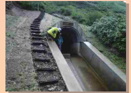
万才谷排水トンネル吐口（赤谷）側