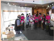
立山カルデラ砂防博物館にて解説を受ける特派員

天候不順のため、当初予定していた立山カルデラ内の視察は叶いませんでしたが、立山砂防事務所内のトロッコ倉庫や国の重要文化財に指定されている本宮砂防堰堤などを見学し、立山砂防管内で実施されている砂防事業について理解を深めました。