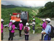
無人化施工車両について学びました！