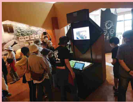
新しく設置されたプロジェクションマッピングで白山から河口までの地形や危険地区をチェック！