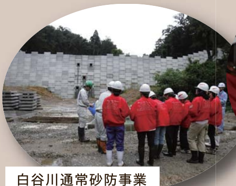
白谷川通常砂防事業