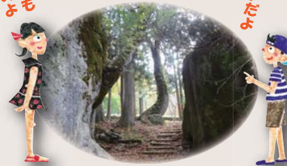
白山砂防科学館より徒歩約5分