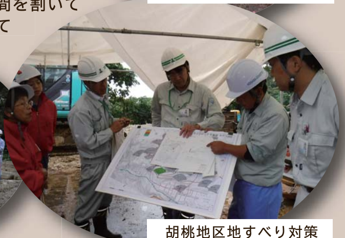
胡桃地区地すべり対策