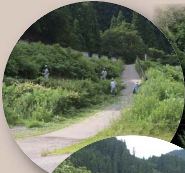
きれいに草が刈られた百万貫の岩周辺

白山市白峰地域の有志団体「百万貫の岩を守る会」により、県の天然記念物「百万貫の岩」周辺の草刈りが行われました。この草刈りは毎年行われており、今年も草刈り自慢の精鋭約30名が参加し、1時間ほどで作業が完了しました。