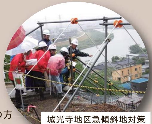
城光寺地区急傾斜地対策

白山砂防女性特派員からもたくさんの質問がされ、とても有意義な見学会となりました。