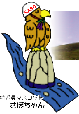
特派員マスコット さぼちゃん