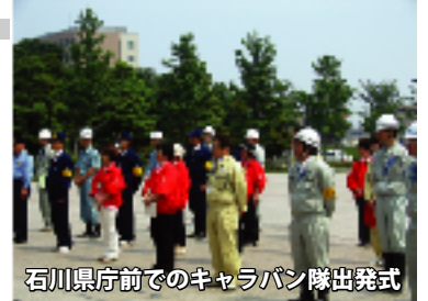
石川県庁前でのキャラバン隊出発式

このような広報活動などを通して、どんどん県内の人々に白山砂防の重要性や土砂災害の事など知っていただくために、香林坊大和前だけではなく、次回からは何班かに別れて金沢駅とか武蔵などで広報活動を行っても良いと思います。(林特派員)