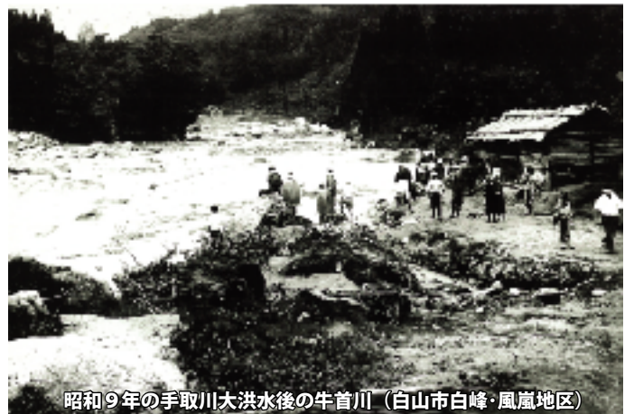
昭和9年の手取川大洪水後の牛首川（白山市白峰・風嵐地区）

7月15日から7月18日にかけては梅雨前線による大雨で土砂崩落が発生しており、引き続き大雨等の気象情報に注意する必要があります。