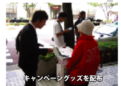
キャンペーングッズを配布