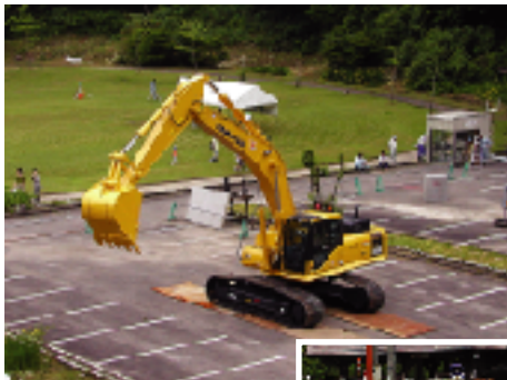
本物のリモコンで パワーショベルの 操作を体験！