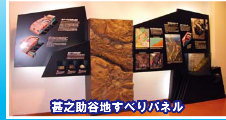
基之助谷地すべりパネル

実際の砂防工事で使われた道具や貴重な資料を展示 もっこを担いで砂防工事体験もできます