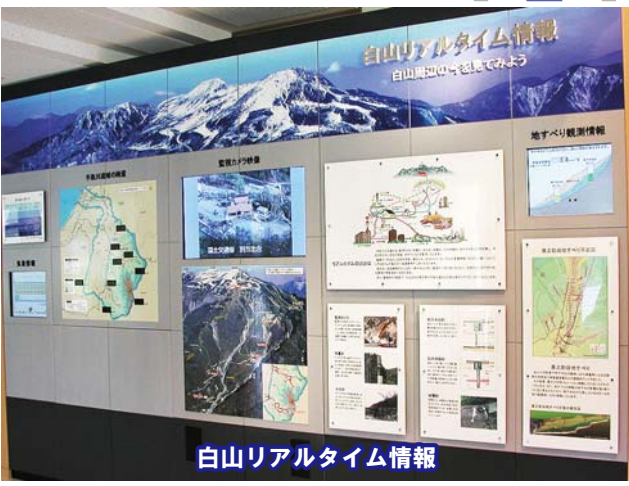
白山リアルタイム情報

白山に設置されたさまざまな防災機器情報をリアルタイムで表示 最新の気象情報や雨量情報、防災カメラ映像などが見られます