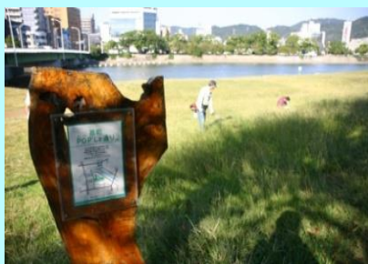
市民団体による看板設置事例 (太田川)